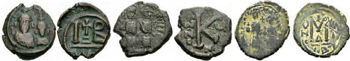
12 Nummi (IB)