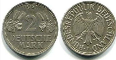
2 DM Ähren, Wein und Weinlaub